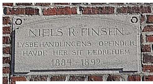
Mindetavle på gammel amtsgård