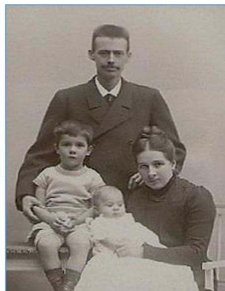
Familien Niels Ryberg Finsen

Siden 1. april 2019 er funktionen overgået til direktøren i Ankestyrelsen, der har udpeget to stiftsamtmænd, én for de jyske stifter og én for resten. Sammen med et stifts biskop udgør stiftamtmanden stadig stiftsøvrigheden, der fører tilsyn.